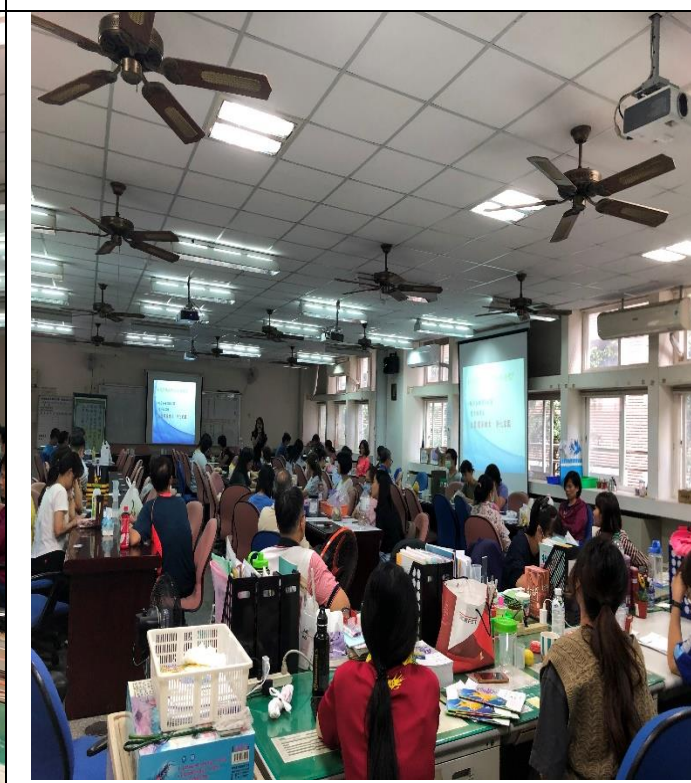
照片說明：同仁們專注聽講