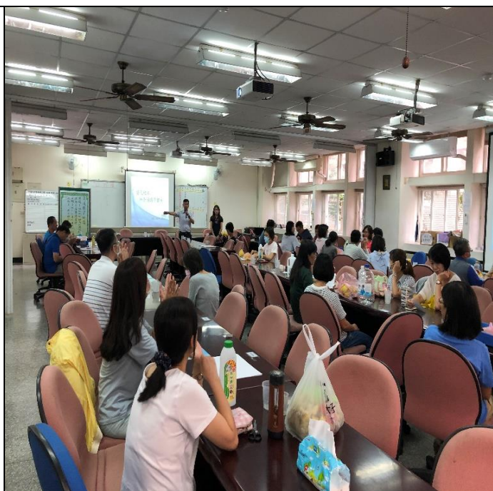
照片說明：認真聽取做酵素的步驟