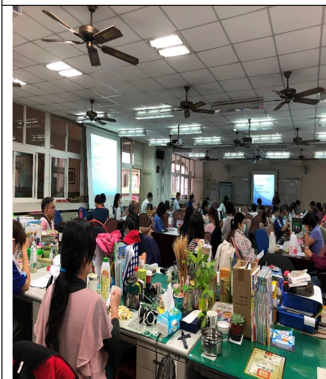
照片說明：講師提供研習獎品