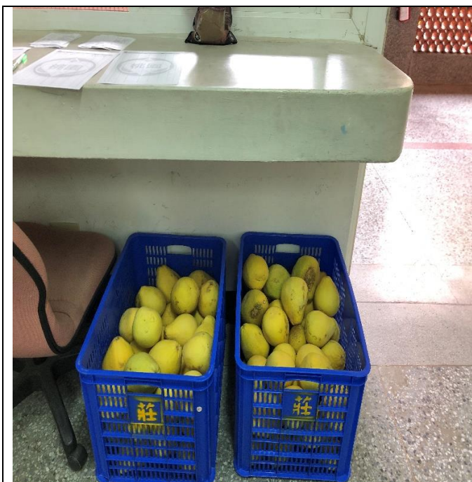
照片說明：同事免費提供鄉下種的柚子