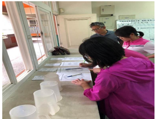
照片說明：同仁簽到