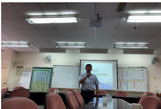
照片說明：校長主持