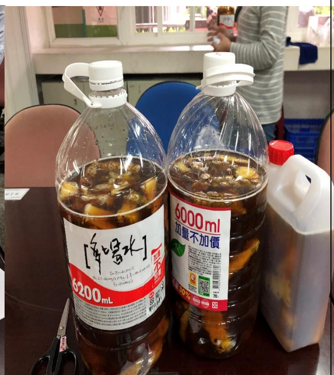
照片說明：成品靜待3個月酵素後啟用