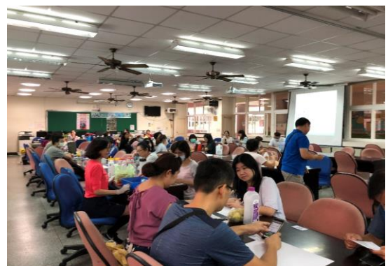
照片說明：環保酵素研習同仁參加踴躍