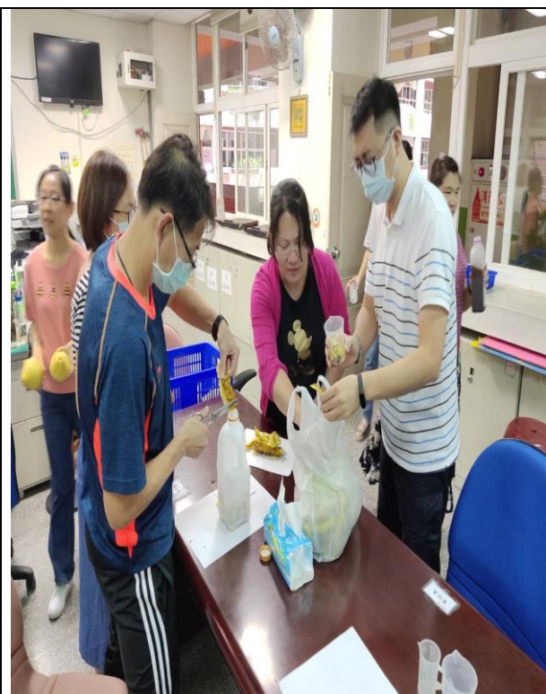
照片說明：酵素實做，大家分工合作