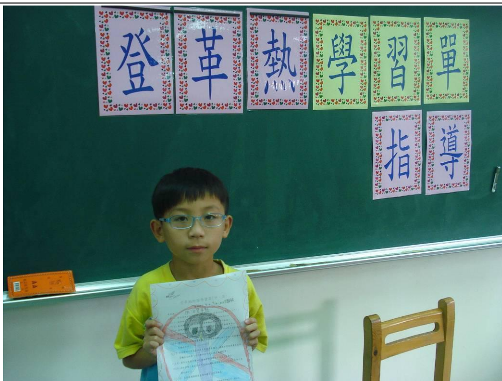
防治登革熱學習單