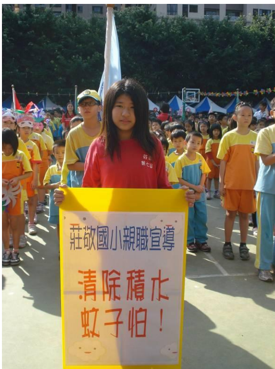
運動會親職宣導：清除積水蚊子怕