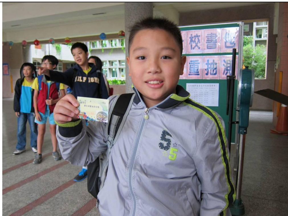
書包未超重者獲得獎勵卡一張