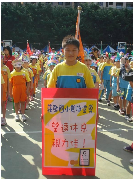
運動會親職宣導：望遠休息視力佳