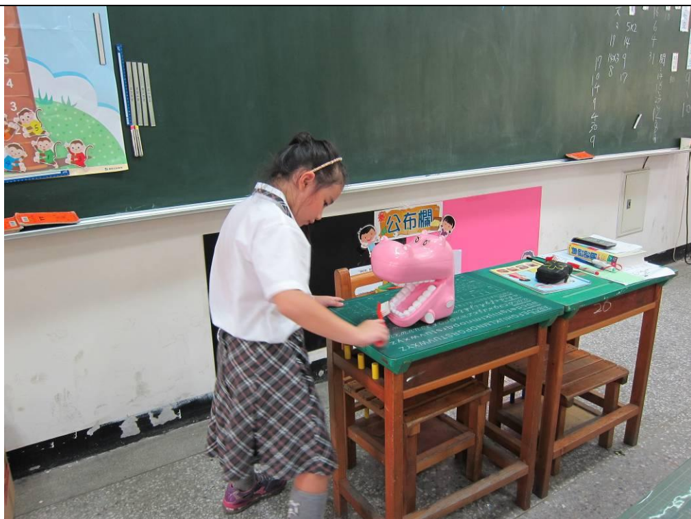
學生認真進行潔牙的動作