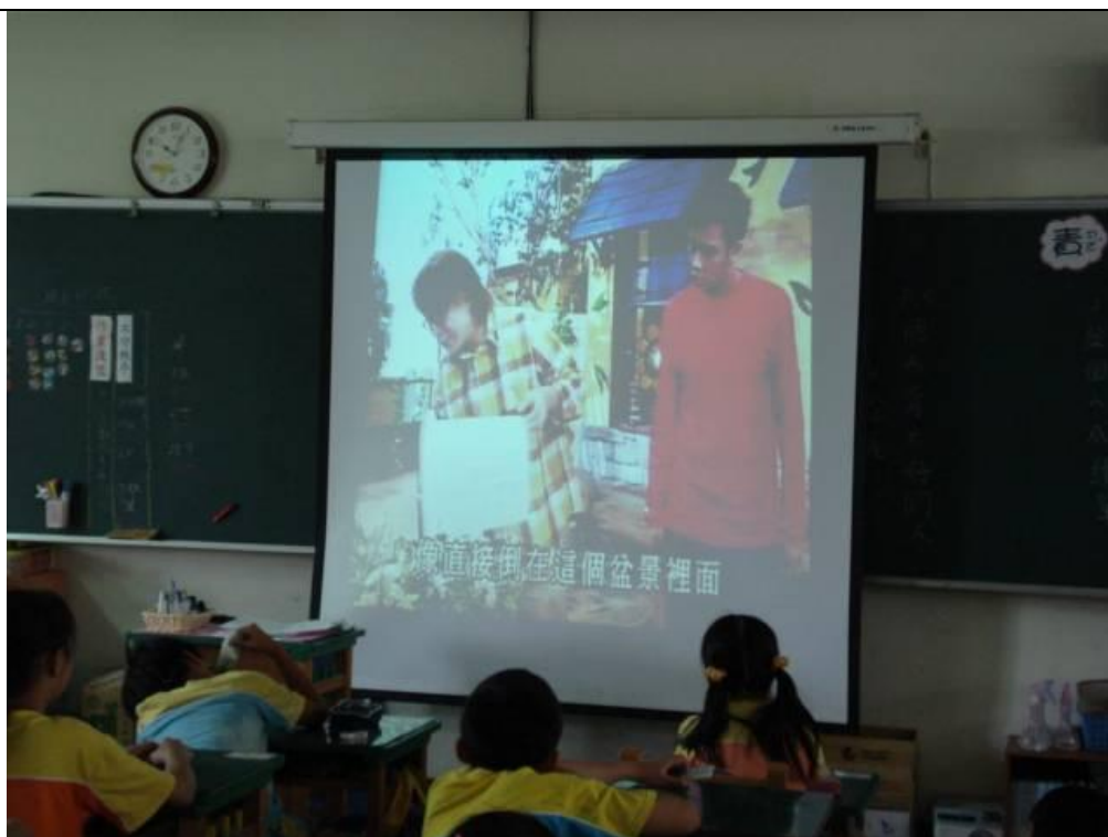
病媒蚊防疫—清理廢棄容器