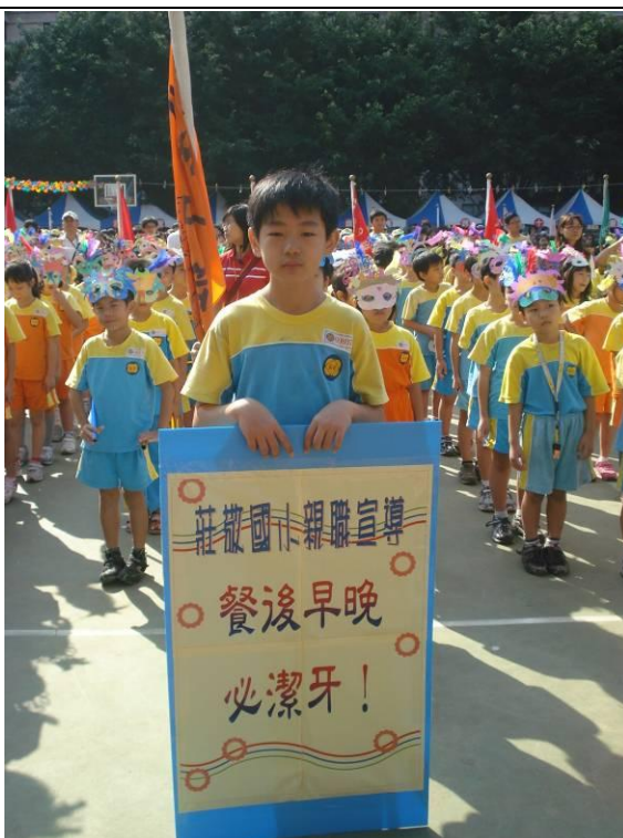
運動會親職宣導：餐後早晚必潔牙