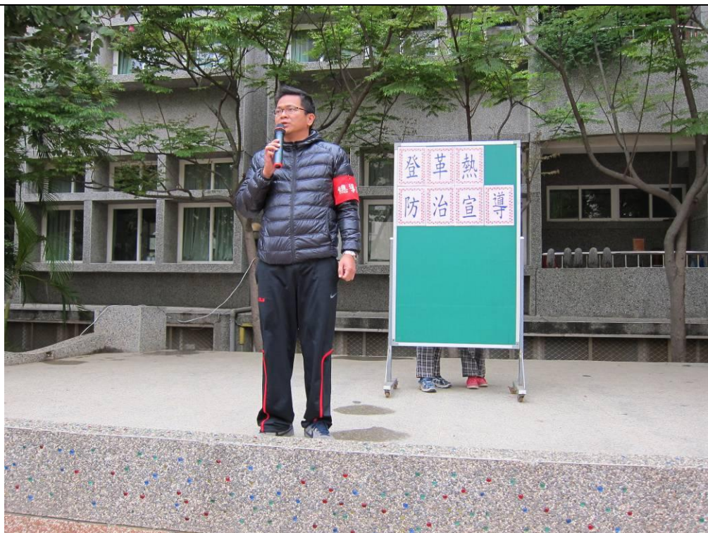
向學生講解登革熱相關知識