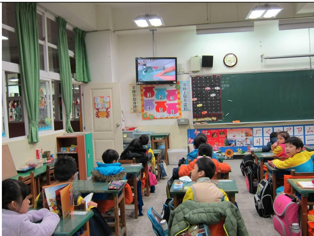
看完宣導影片，學生們都能熟記洗手時機及五步驟