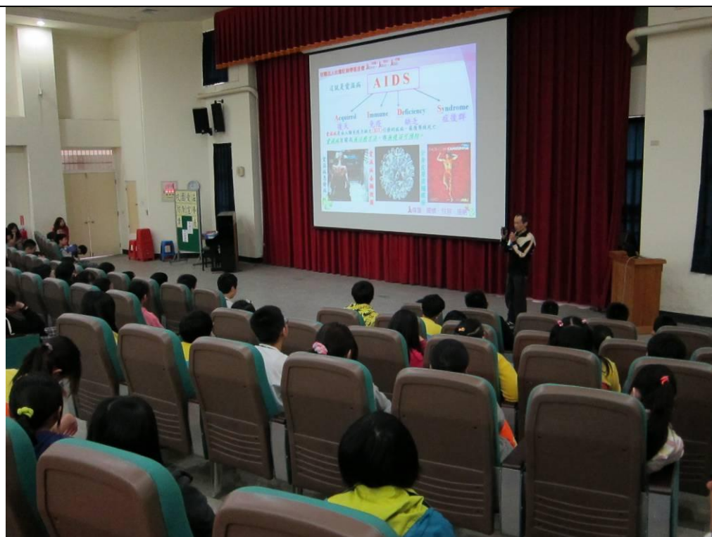
教導學生認識愛滋病