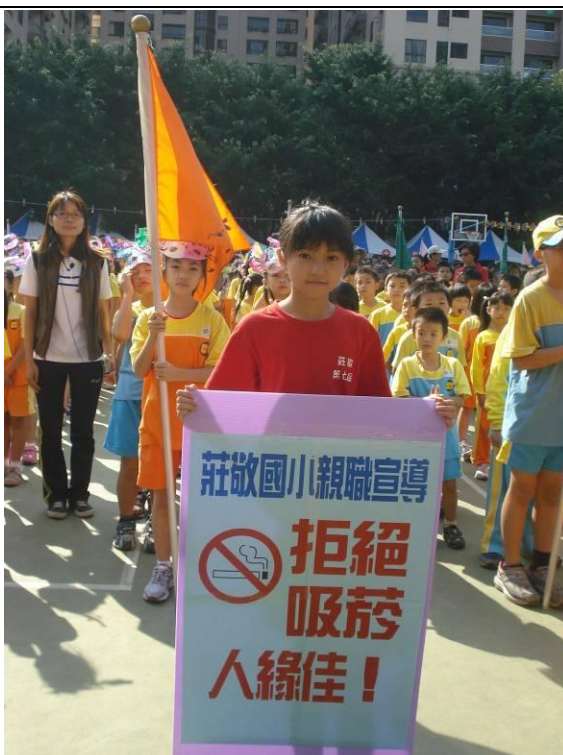
運動會親職宣導：拒絕吸菸人緣佳