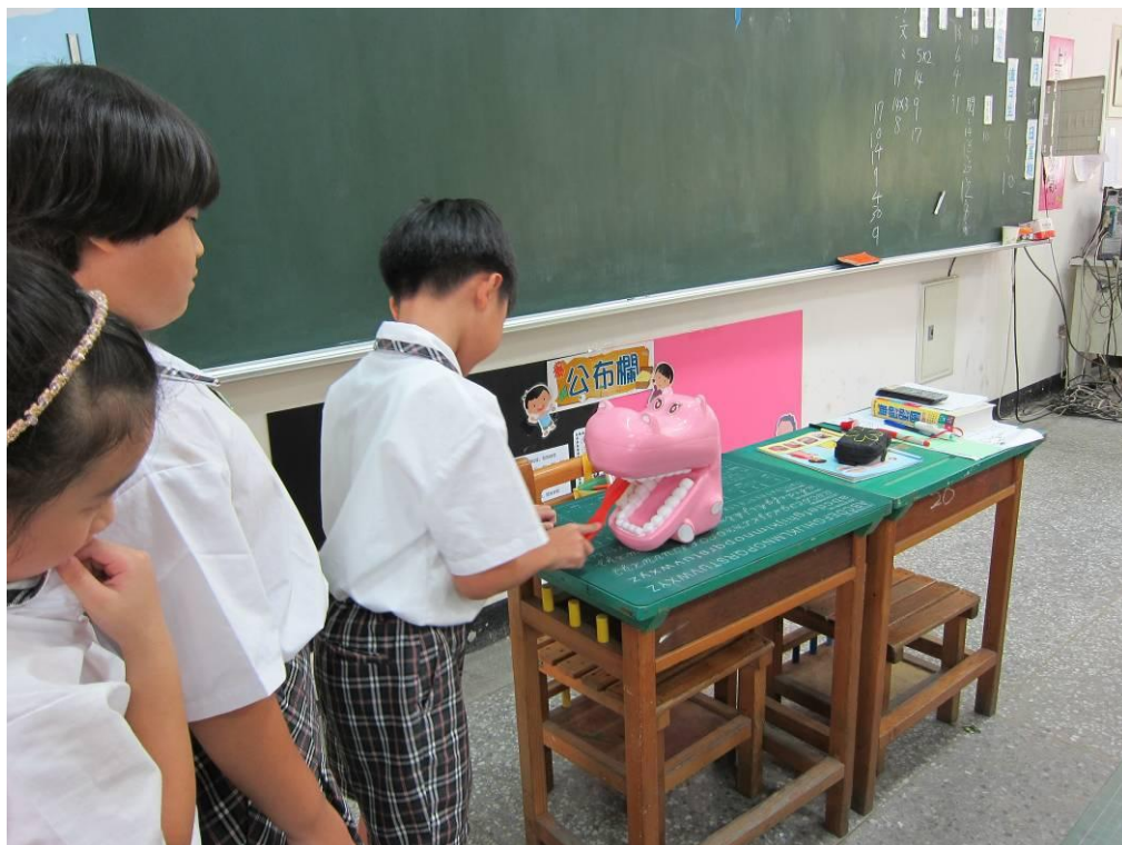
學生認真進行潔牙的動作