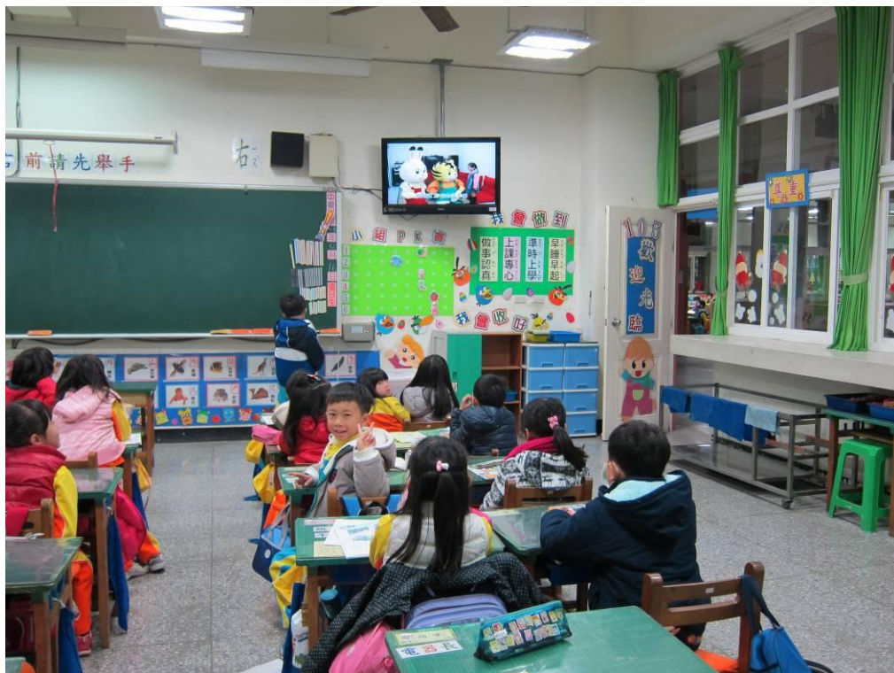
兒童朝會校園直播--學生們正專心的收看