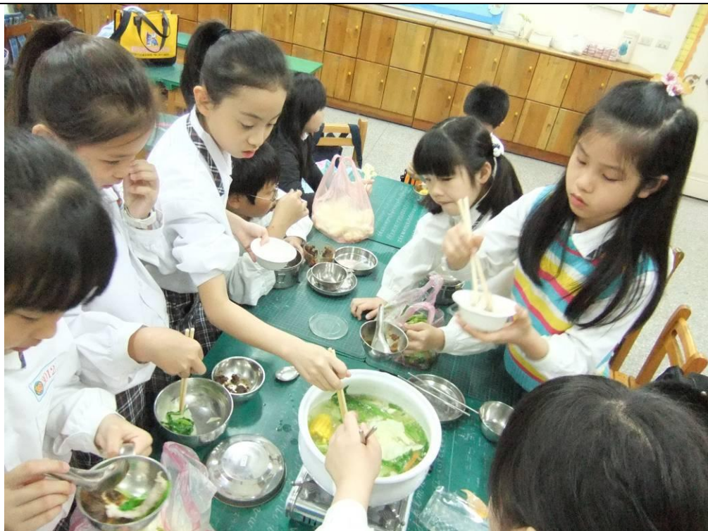
自己種青菜的最美味