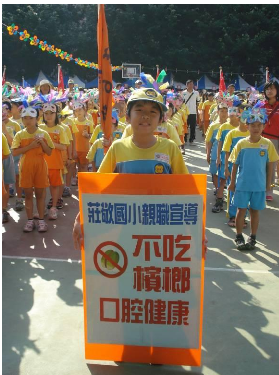
運動會親職宣導：不吃檳榔口腔健康