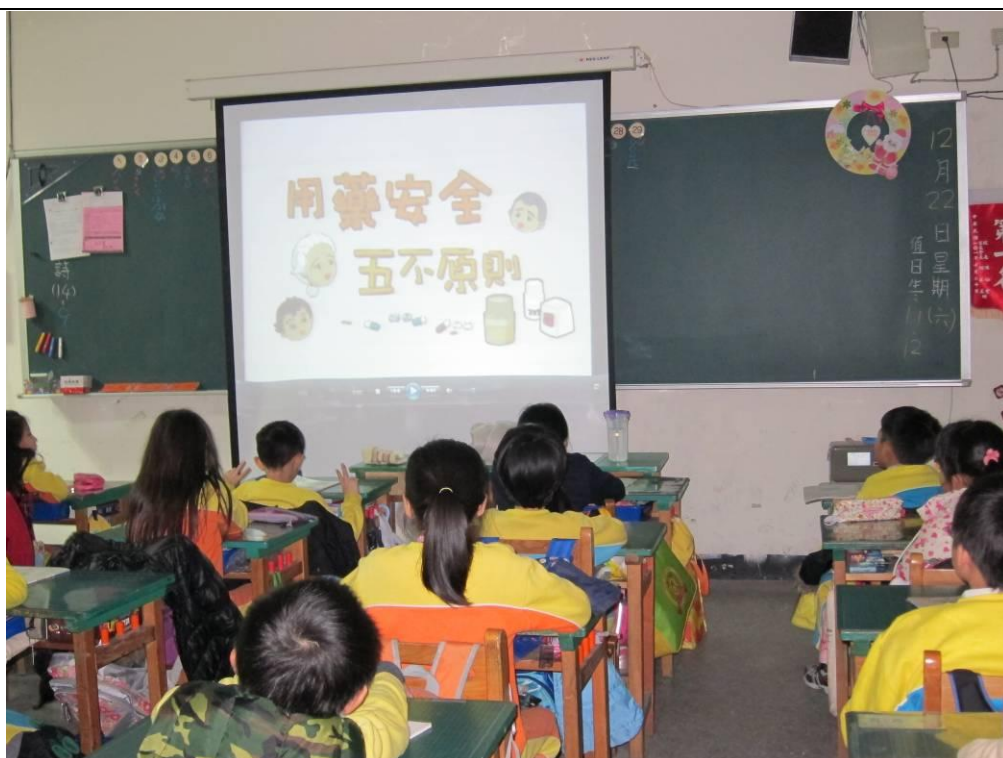
在健康課時將「用藥安全」議題融入課程中