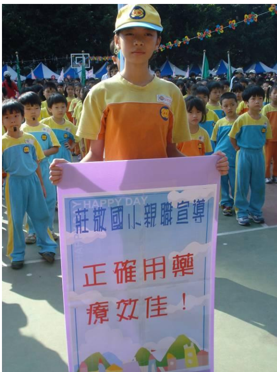
運動會親職宣導：正確用藥療效佳