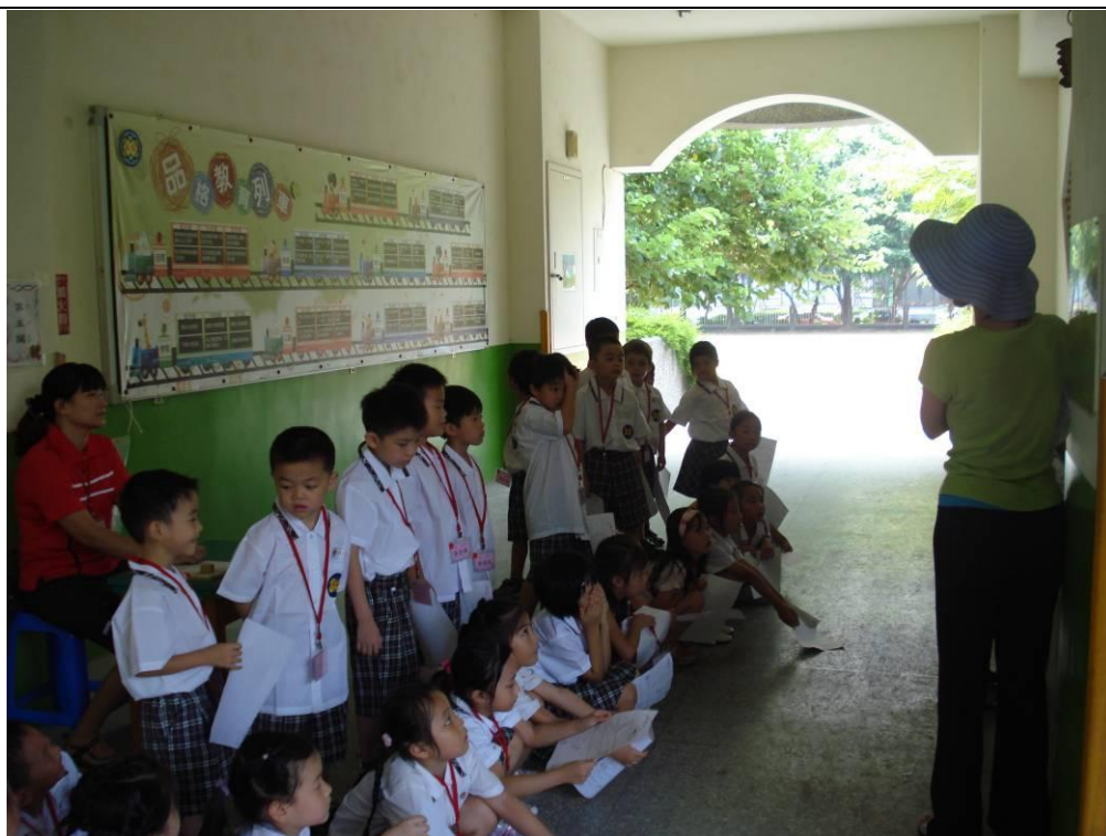
小一新生排隊準備進行洗手闖關