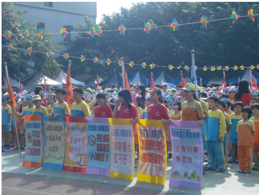
利用運動會向社區人士進行健康促進宣導