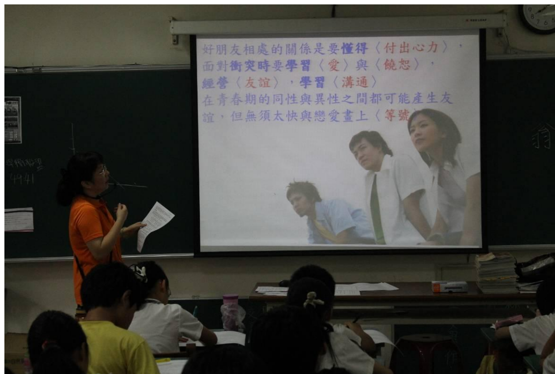
教導學生兩性之間如何互動