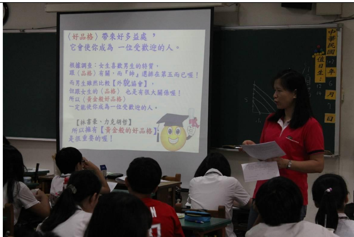
教導學生兩性之間如何互動