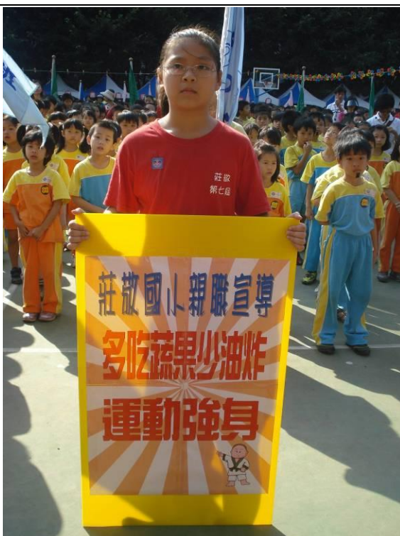
運動會親職宣導：多吃蔬果少油炸 運動強身